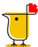
蛋卷基金 V 蛋卷基金是「雪球」出品的基金APP