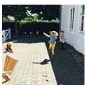
最接地气美股解读