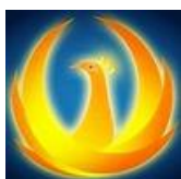
金凤一号 V 消费品汽车航运领域研究达人