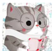
访谈小秘书 V 雪球访谈小秘书官方账号